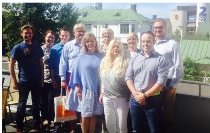
Delar av den glada truppen....

Vi som sedan våren 2016 deltar i Ålands Näringslivs hållbarhetskurs har valt att med god framförelse föregå de krav som ställs enligt EU direktivet.