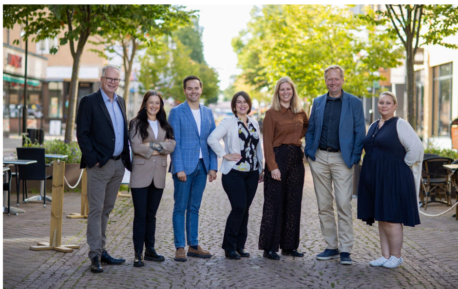
Ålands Näringslivs personal, sensommaren 2025.