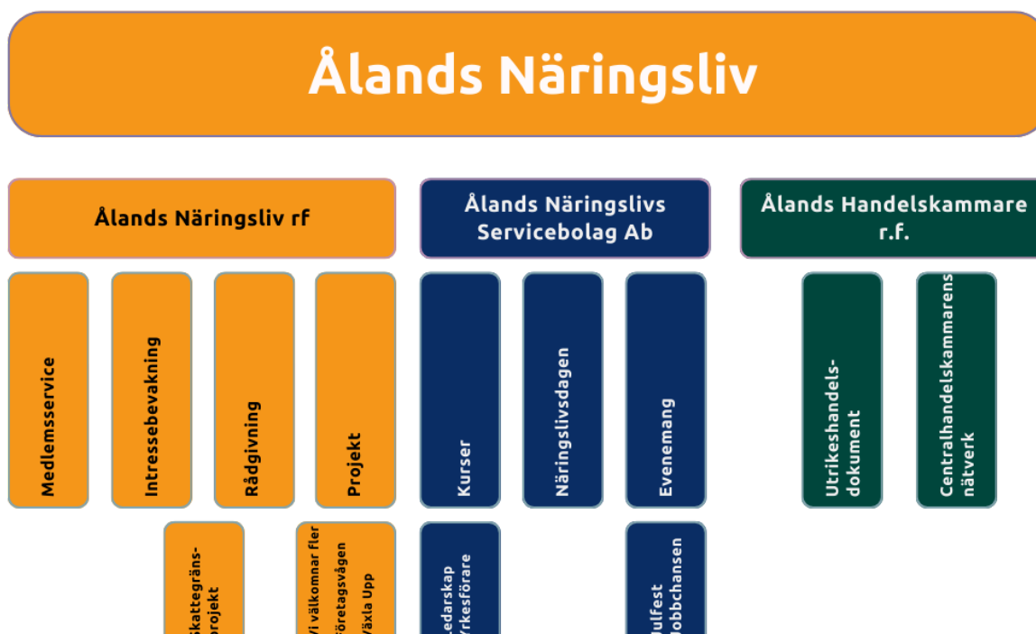
Figur 1: Ålands Näringslivs organisation

Då föreningen Ålands Näringsliv bildades 2011 bestod organisationen av två föreningar (Ålands Näringsliv samt Ålands Handelskammare). Båda föreningarna är aktiva idag. Under 2014 grundades Ålands Näringslivs Servicebolag Ab, vilket är ett helägt dotterbolag till Ålands Näringsliv r.f. Servicebolaget arrangerar Ålands Näringslivs kurser och evenemang. Ålands Näringsliv bedriver således idag verksamhet under tre olika juridiska personer, även om vi på Åland alltid beskriver oss som "Ålands Näringsliv".