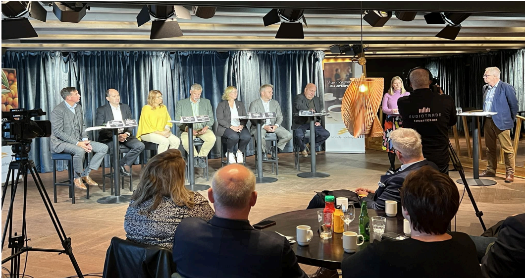
Foto från valdebatten inför lagtingsvalet.