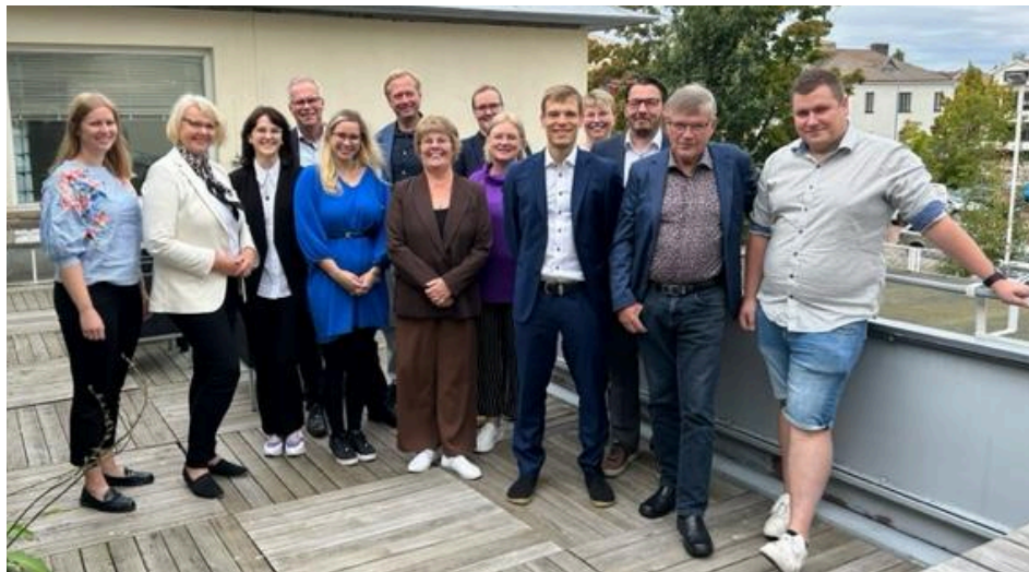
Ålands Näringsliv och Kristinestads Näringslivscentral.

Under året har Ålands Näringsliv bland annat träffat Sveriges generalkonsul på Åland, Ukrainas ambassadör i Finland, Föreningen Norden i Örebro, besökt Ålands representation i Helsingfors, representant från Kanadas ambassad i Finland, möte med Centralhandelskammarens vd samt representanter från Finlands Näringsliv EK. En delegation från karibiska Bonaire har varit på besök för att lära sig mer om den åländska modellen. Regelbundet har Ålands Näringsliv haft kontakt med Visit Åland och dess personal. Kristinestads Näringslivscentral kom på studiebesök till Åland i september och en grupp företagare från Estland fick information om näringslivet på Åland i juni.