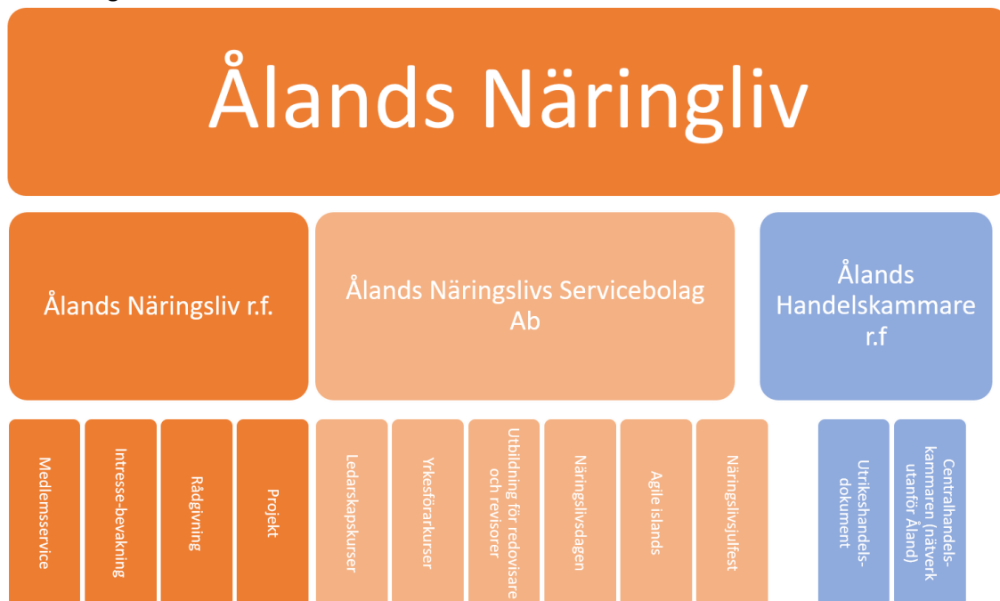
Figur 1: Ålands Näringslivs organisation

Då föreningen Ålands Näringsliv bildades 2011 bestod organisationen av två föreningar (Ålands Näringsliv samt Ålands Handelskammare). Båda föreningarna är aktiva idag. Under 2014 grundades Ålands Näringslivs Servicebolag Ab, vilket är ett helägt dotterbolag till Ålands Näringsliv r.f. Servicebolaget arrangerar våra kurser och evenemang. Ålands Näringsliv bedriver således idag verksamhet under tre olika juridiska personer, även om vi på Åland alltid beskriver oss själva som "Ålands Näringsliv".